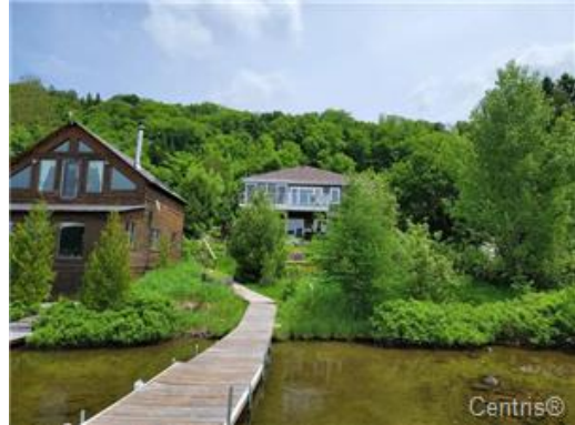
Bord de l'eau