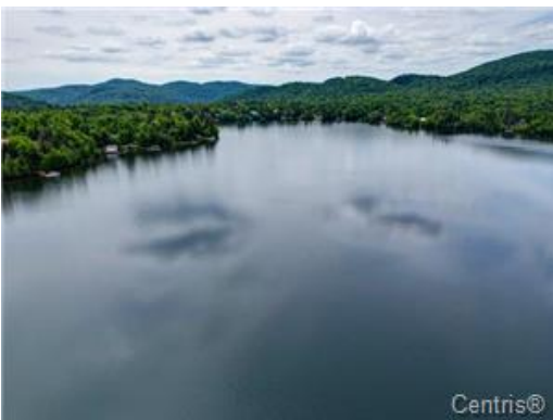
Vue sur l'eau