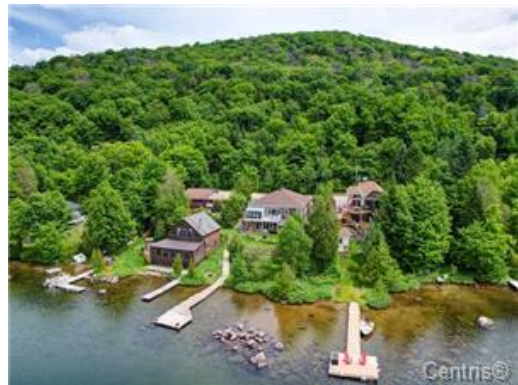
Bord de l'eau