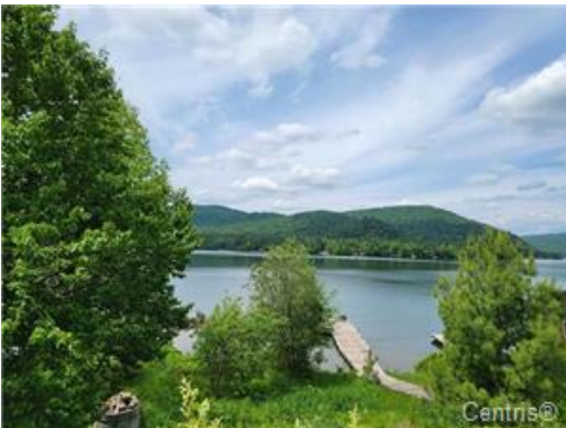
Bord de l'eau